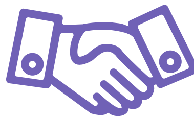
SERVEI EMPRENEDORIA I EMPRESSES