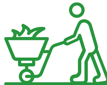
EL PIVEM I ALTRES PLANS OCUPACIONALS